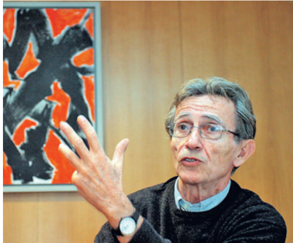
El autor recuperó notas acumuladas durante cuarenta años

Más que unas memorias formales, Demonios íntimos son una confesión; el sabor que deja es el mismo de aquellas madrugadas, tras una noche en blanco por estudios o por farra, en que tu amigo o tu amiga, relajadas todas las defensas, acababa por contarte